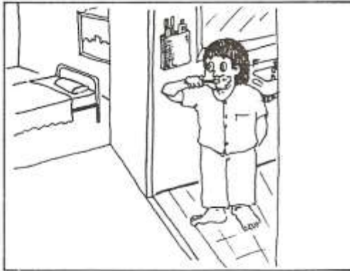
ก๊วกโก่จัดที่นอนเรียบร้อยแล้วแปรงฟัน