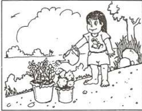
กลับจากโรงเรียนก๊วกโก่ช่วยรดน้ำต้นไม้

คำชี้แจง ให้นักเรียนเรียงประโยคจากภาพตามลำดับเหตุการณ์เขียนลงด้านล่าง