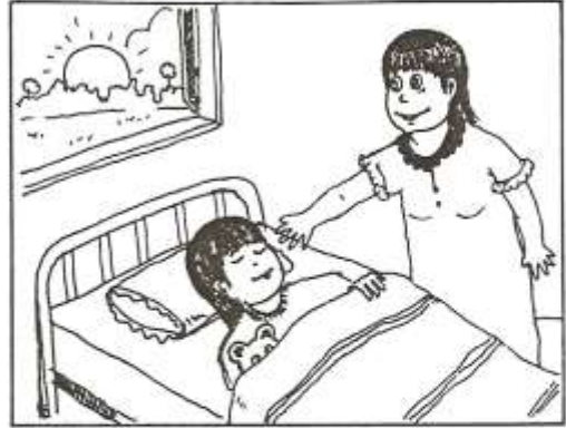
แม่ปลุกก๊วกโก่แต่เช้า