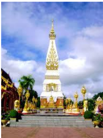
พระธาตุพนม จังหวัดนครพนม

อาณาจักรโคตรบูร เกิดจากการรวมตัวของเมืองบริเวณสองฝั่งแม่น้ำโขงตอนกลาง ศูนย์กลางของอาณาจักรโคตรบูรเชื่อว่า ตั้งอยู่ที่จังหวัดนครพนมในปัจจุบัน เพราะปรากฏหลักฐานทางโบราณคดีที่สำคัญ ได้แก่ พระธาตุพนมที่มีอายุเก่าแก่นับพันปี ซึ่งเป็นที่เคารพบูชาของคนสองฝั่งแม่น้ำโขงจนถึงปัจจุบัน