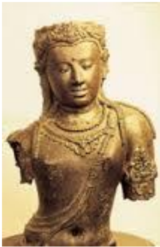
รูปหล่อสำริดพระโพธิสัตว์อวโลกิเตศวร

อาณาจักรศรีวิชัย เกิดจากการรวมตัวของเมืองทางตอนใต้ มีอาณาเขตครอบคลุมบริเวณทางตอนใต้ของไทยไปจนถึงสุมาตราและชวา ทั้งนี้เนื่องจากการขุดพบโบราณสถานและโบราณวัตถุในสมัยศรีวิชัยมากมาย เช่น พระบรมธาตุไชยา รูปหล่อสำริดพระโพธิสัตว์อวโลกิเตศวร เป็นต้น