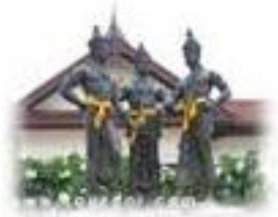
พระบรมราชานุสาวรีย์สามกษัตริย์ พญามังราย พญางำเมือง และพ่อขุนรามคำแหง ที่เมืองเชียงใหม่

พญามังราย แห่งเมืองเชียงรายได้เป็นกษัตริย์ที่มีพระปรีชาสามารถได้รวบรวมกำลังพลยกไปตีเมืองต่าง ๆ แถบที่ราบลุ่มเชียงรายได้แก่ พะเยา และที่ราบลุ่มเชียงใหม่ และลำพูนไว้ในอำนาจหมด และได้สร้างเมืองเชียงใหม่เป็นศูนย์กลางของอาณาจักรใน พ.ศ. 1839 ซึ่งต่อมาเรียกว่า อาณาจักรล้านนา