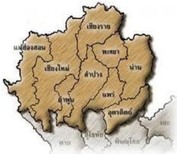
แผนที่สังเขปแสดงที่ตั้งอาณาจักรล้านนา

อาณาจักรล้านนาก่อตั้งขึ้นเมื่อประมาณ พ.ศ. 1800 ณ บริเวณที่ราบเมืองเชียงใหม่ และ ลำพูน ในขณะที่แคว้นทริภุญชัยกำลังอ่อนอำนาจลง