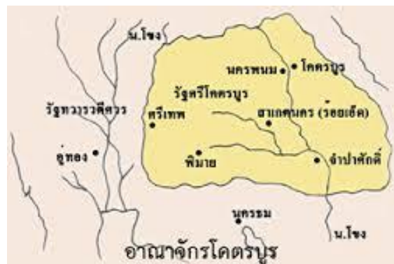
แผนที่สังเขปแสดงที่ตั้งอาณาจักรโคตรบูร