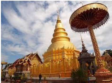
พระธาตุทริภุชชัย จังหวัดลำพูน

ความเจริญของอาณาจักรทริภุชชัยได้กระจายไปจนพัฒนาเป็นวัฒนธรรมในกลุ่มแม่น้ำปิง และลุ่มแม่น้ำวังตอนบนที่มีเอกลักษณ์เฉพาะ เช่น สถาปัตยกรรมล้านนา ความเชื่อตามคติพระพุทธศาสนา