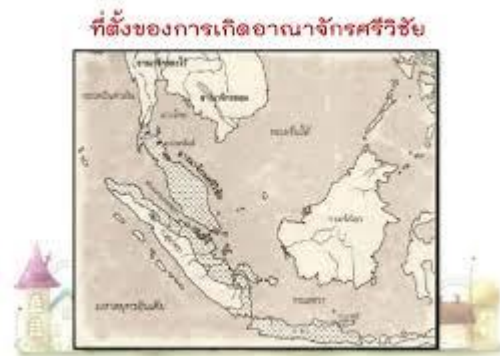
แผนที่สังเขปแสดงที่ตั้งอาณาจักรศรีวิชัย