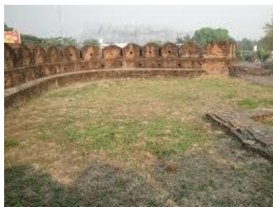
ป้อมและแนวกำแพงเมืองโบราณ ที่จังหวัดเชียงใหม่

อาณาจักรล้านนากลายตัวเจริญรุ่งเรืองมากขึ้นในทุก ๆ ด้านทั้งด้านศิลปวัฒนธรรม ศาสนา อักษรศาสตร์ โดยเฉพาะด้านศาสนานั้นเจริญรุ่งเรืองมาก มีการสร้างวัด เจดีย์ และ พระพุทธรูปจำนวนมาก