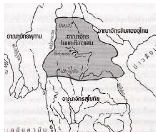
แผนที่สังเขปแสดงที่ตั้งอาณาจักรโยนกเชียงแสน

ริมฝั่งแม่น้ำโขงในเขตอำเภอเชียงแสน จังหวัดเชียงราย พบเครื่องมือหินของมนุษย์โบราณจำนวนมาก